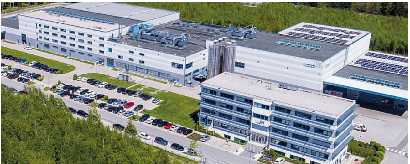
Der Hauptsitz der Unternehmensgruppe Kraiburg TPE in Waldkraiburg/Bayern.

Die Mitarbeitenden des bayerischen Gummiwerks arbeiten in Produktionsbereichen, in denen täglich Kautschuk- und Silikonmischungen verarbeitet werden. Daraus ergeben sich hohe Anforderungen an Temperaturregelung, Luftaustausch und Luftqualität. Die bisherige Heizungsanlage war weder energieeffizient noch den veränderten Bedingungen gewachsen. Das Ziel: Ganzjährige Temperierung, bessere Luftqualität und ein System, das sich in die bestehende Struktur integrieren lässt – trotz Platzmangel.