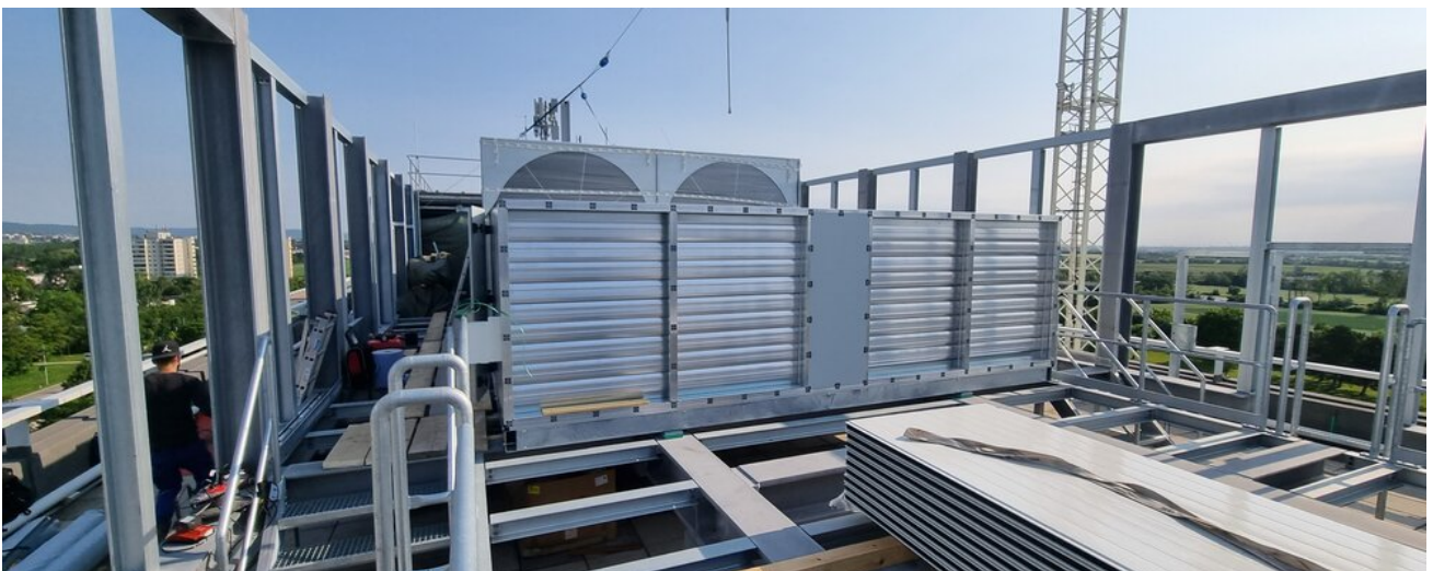
Dank Vor-Ort-Montage: Bravouröse Bewältigung begrenzter Fläche und anspruchsvoller Standortbedingungen

Die intelligente Anordnung von zwei Rotationstauschern, flankiert von jeweils vier Ventilatoren für Zuluft und Abluft, gewährleistet die Einhaltung sowohl der geltenden EU-Verordnung 1253/2014 als auch der baulichen Anforderungen. Technisch beeindruckt jedes Gerät durch seine selbsttragende Konstruktion, ausgestattet mit abnehmbaren Sandwichpaneelen aus verzinktem Stahlblech. Für optimale Hygiene und akustische Entkopplung sind die Innen- und Außenflächen nahtlos und körperschallentkoppelt. Zusätzlich sind alle wartungs- oder inspektionsbedürftigen Einbauteile mit hermetisch abdichtenden Inspektionstüren versehen.