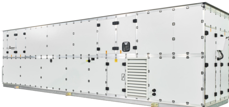
RLT-Anlage für die Großküche des Pflegeheim Edeweicht

Energieeffizienz und Wirtschaftlichkeit spielten neben einer normgerechten Ausführung der Gesamtanlage ebenso eine entscheidende Rolle. Um die Montagezeit so kurz wie möglich zu halten und unnötige Schnittstellen zu reduzieren, wurde das Lüftungsgerät als "steckerfertige" Einheit konzipiert. Es wurde in Vorarlberg gefertigt, per Sondertransport nach Edeweicht geliefert und mit einem Autokran aufs Dach an seinen neuen Bestimmungsort gehoben.