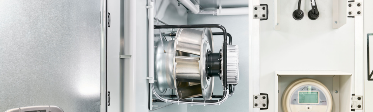
EC-Ventilatoren als Standardausführung für die Zuluft.