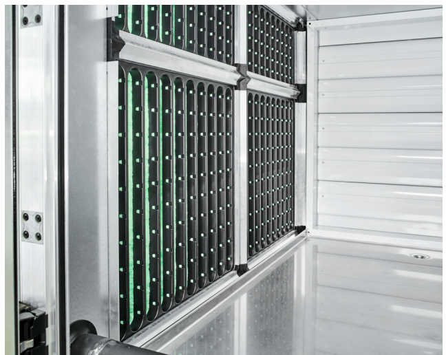
Der Kompaktfilter für die Zuluft (links) und der Taschenfilter für die Außenluft (rechts) sind zwei der vier Filter im Gerät.