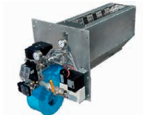
Gasflächenbrenner mit nahezu 100 % Energieeffizienz. Die Kosten für den Bau eines Rauchgaskamins entfallen.