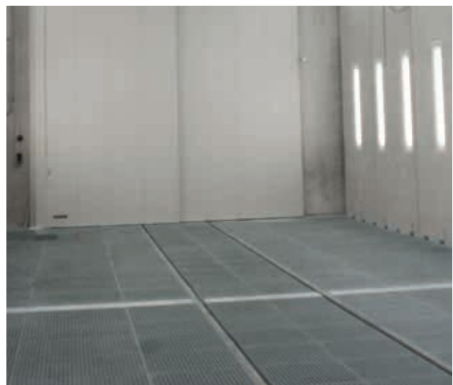
Sektionalsschaltung: Betrieb von nur einem Teilbereich für die Bearbeitung von Kleinteilen spart Kosten.