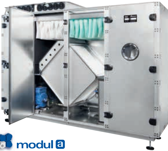
Normenkonformes, modulares Gehäusesystem mit Bestnoten in punkto Energieeffizienz und Isolationswerte.

In der Konzeptphase steckt das größte Sparpotenzial